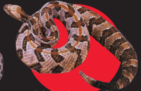
Crótalo de los cañaverales