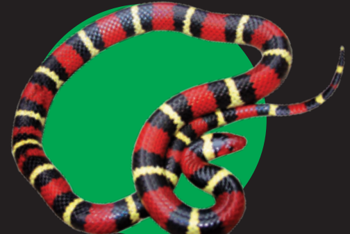
Scarlet King Snake