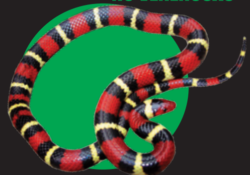
Serpiente rey escarlata