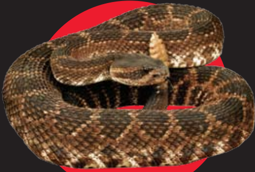
Serpiente oriental de cascabel (crótalo) de dorso de diamante